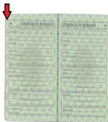
Página do Contrato de Trabalho em Branco