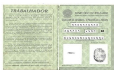
Página da Foto