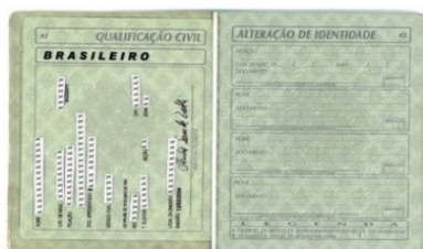
Página de Identificação